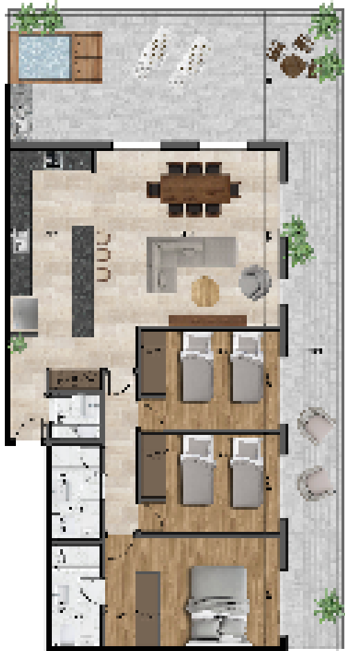
UNIDAD 3 - DORMITORIOS CON VISTA AL RÍO PARANÁ