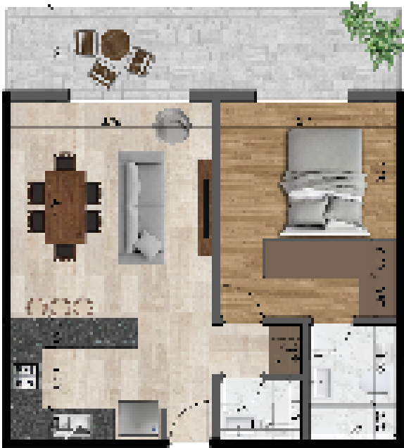
UNIDAD 1 - DORMITORIO CON TOILETTE