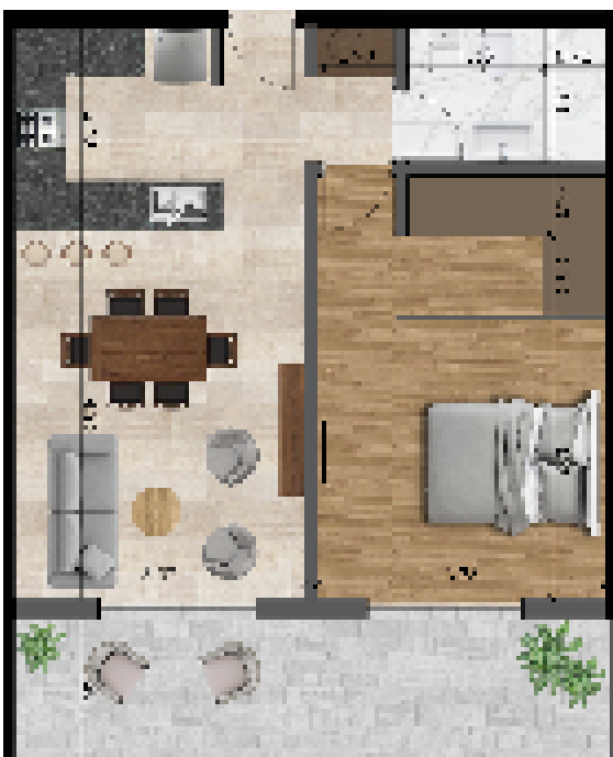
UNIDAD 1 - DORMITORIO