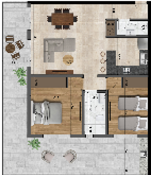
UNIDAD 2 - DORMITORIOS 1º PISO CONTRAFRENTE