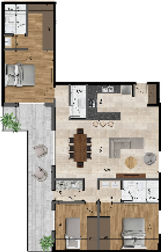
UNIDAD 3 - DORMITORIOS CON DOBLE VISTA